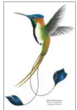
Violettscheitel-Flaggensylphe Colibrí Maravilloso Dibujo: Corporación Turístico Amazónica

Los textos publicados reflejan la opinión del autor que no necesariamente es la de los editores