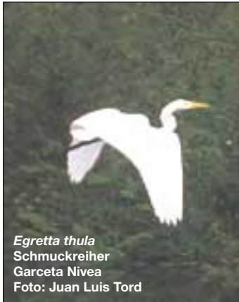
Egretta thula Schmuckreiher Garceta Nivea

Etwa 80 km fahren wir auf diesem riesigen Strom flussabwärts bis zum Explorama Lodge, wo wir die Beobachtung von Vögeln im Regenwald beginnen. In der Umgebung wurden über 400 verschiedene Vögel registriert (eine Aufstellung ist am Ende dieses Artikels zu finden). So sind z.B. der Schwarzstirnrappist , der Drosselzaunkönig , die Sonnenralle , blaue , gelbe und rote Papageyen hier zu finden. Auf dem Pfad zum See können der Mangroven-