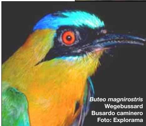
Buteo magnirostris Wegebussard Busardo caminero

Cabecidorado und den Saltarín Barbiblanco in sus rutas de despliegue.