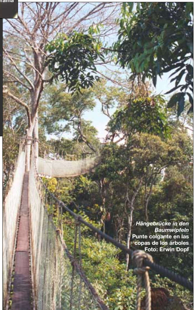
Hängebrücke in den Baumwipfeln Punte colgante en las copas de los árboles

Otra excursión que haremos en bote a lo largo de uno de los afluentes del Napo, nos hará apreciar