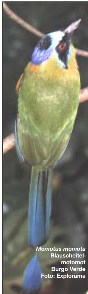
Momotus momota Blauscheitel- motomot Burgo Verde

Sehr früh am Morgen begeben wir uns wieder zur Hängebrücke, um den neuen Tage oben in den Baum-