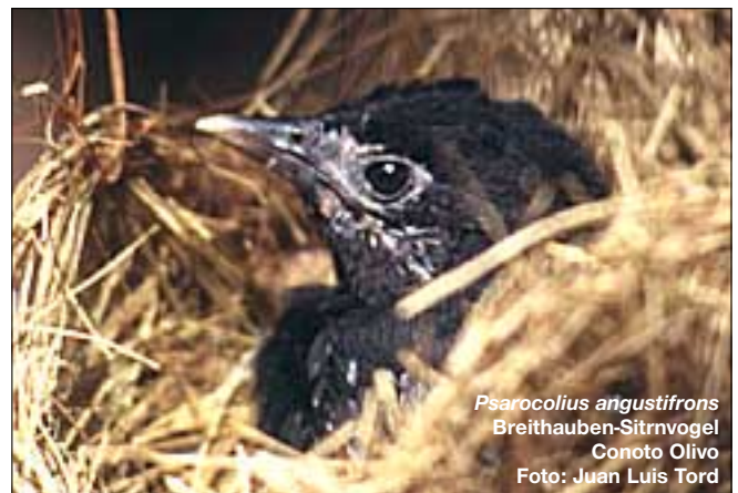
Psarocolius angustifrons Breithauben-Sitrvogel Conoto Olivo