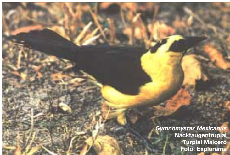
Gymnomystax Mexicanus Nacktaugentrupial Turpial Maicero

ameisenvogel und der Blassfußtöpfer beobachtet werden.