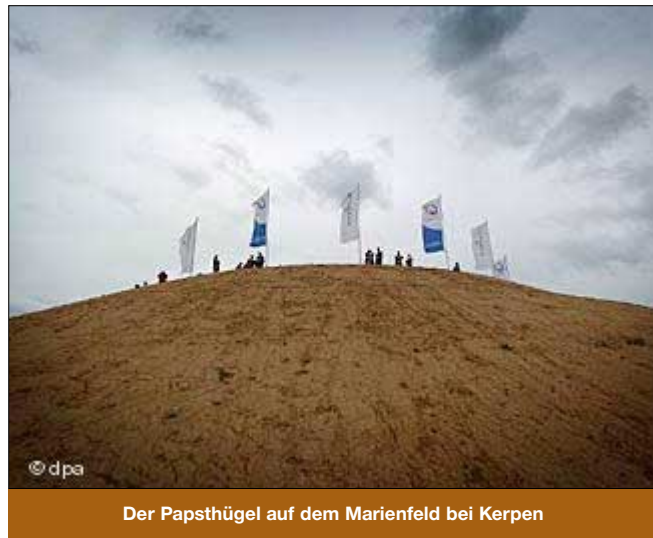
Der Papsthügel auf dem Marienfeld bei Kerpen

von Papst Johannes Paul II. ins Leben gerufen, feiert der Weltjugendtag im Jahr 2005 sein 20. Jubiläum. Zu dem großen Glaubensfest werden bis zu eine Million Gäste im Alter zwischen 16 und 30 Jahren aus mehr als 120 Ländern sowie hochrangige Kirchenvertreter erwartet.