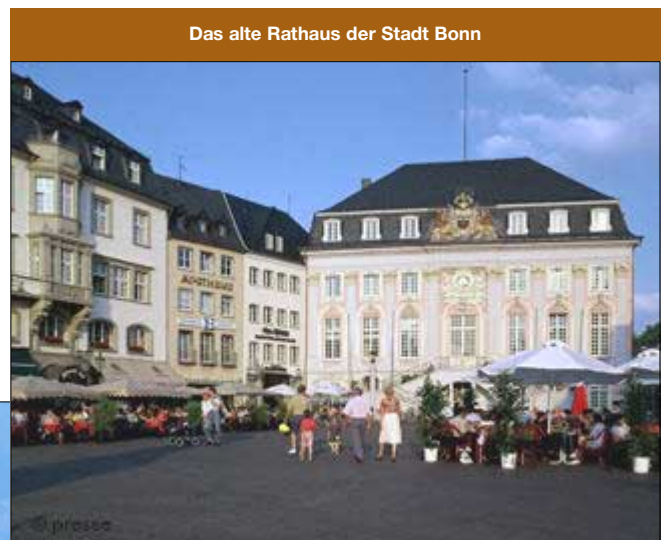
Das alte Rathaus der Stadt Bonn