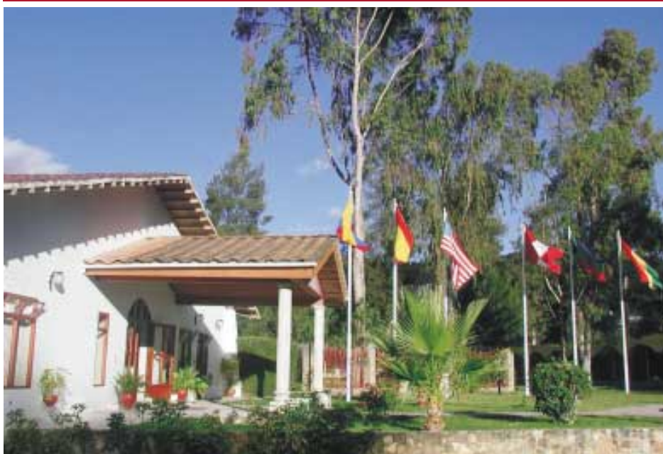
Centro de Convenciones - Spa - Masajes - Restaurant - Cafetería - Bar - Deportes - Descanso - Recreación