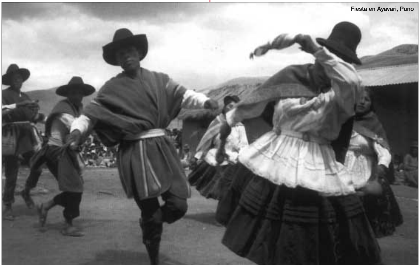
Fiesta en Ayavari, Puno