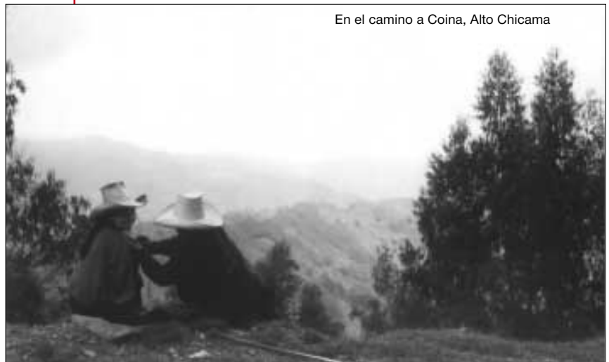
En el camino a Coima, Alto Chicama

Inicio de una fase de afianzamiento del trabajo del DED en el Perú. A los cooperantes se les concede estatus de expertos.